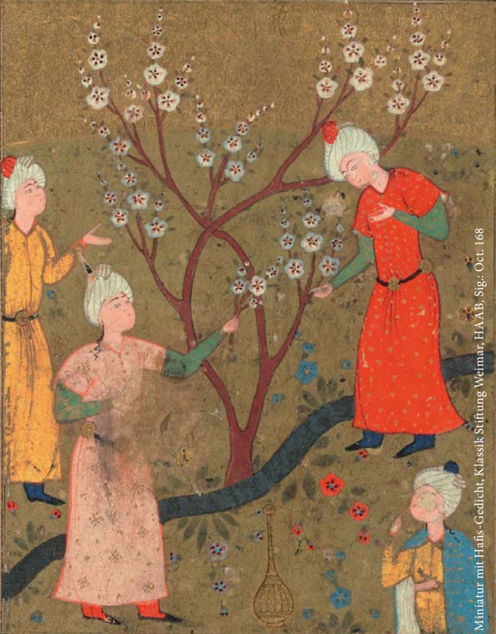
Miniatur mit Hafis-Gedicht, Klassik Stiftung Weimar, HAAB, Sig.: Oct. 168

کرم از دست برخیزد که باد لذاریم ز جام وصل می نوشم ز باغ عیش گلان